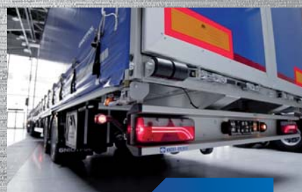
nowoczesne oświetlenie LED