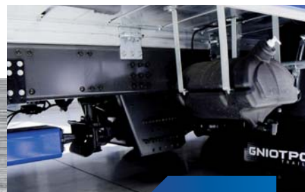
wygody zbiornik na wodę z dozownikiem płynu