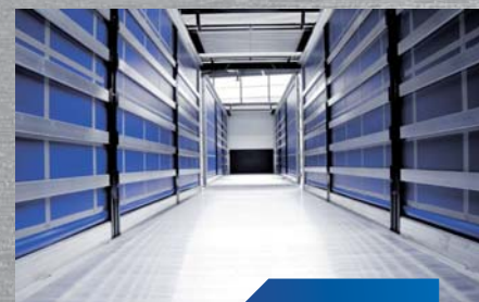
system przejazdowy z przyczepy na samochód