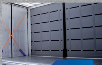
certyfikowany system nadwozi bez desek stelaża