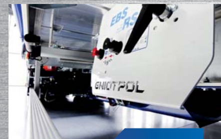
nowoczesny system pneumatyczny