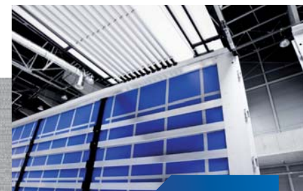
niezależnie rozsuwany i podnoszony dach