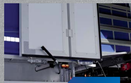
wzmocniony trzymacz drzwi