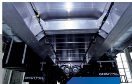
w pełni aluminiowa konstrukcja ramy i podłogi