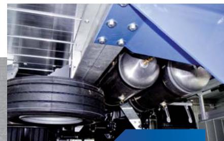
aluminiowe zbiorniki powietrza