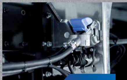
pneumatyczne złącze DUOMATIC