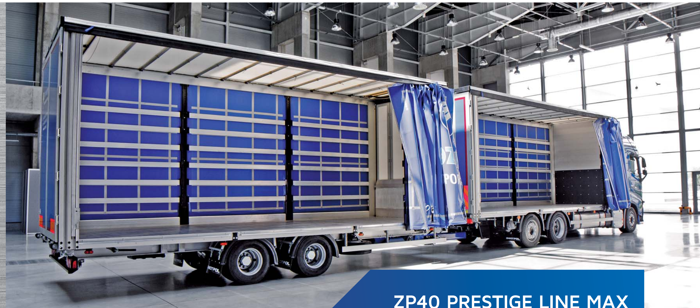
ZP40 PRESTIGE LINE MAX

Sprawdź naszą ofertę w interencie: www.gniotpol.pl