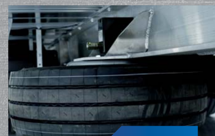
winda koła zapasowego przyczepy