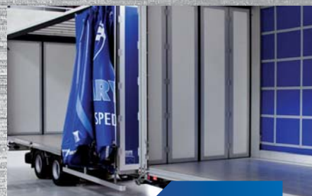
wzmocnione, uszczelnione i lżejsze drzwi z wypełnieniem PU