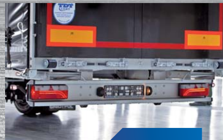
nowoczesne oświetlenie LED