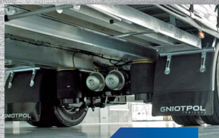
wzmocniona oś przyczepy 11 ton