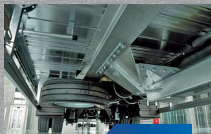
wzmocniona aluminiowa rama przyczepy