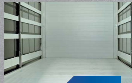
wzmocniona aluminiowa podłoga