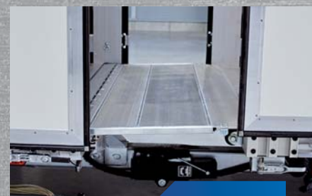
trap przejazdowy 4 tony