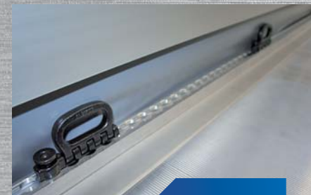
certyfikowany system mocowania ładunku MULTILOCK GNIOTPOL