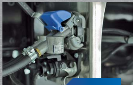
złącze DuoMatic w standardzie